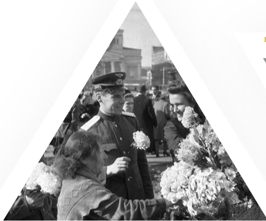
Цветы памяти Парады на Дальнем Востоке